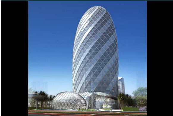
Pearl Tower, Soi Aree, Phaholyothin Road, Bangkok, Thailand