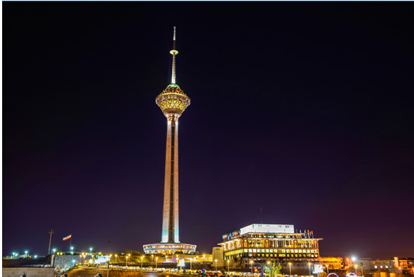
Milad Tower, Tehran, Iran